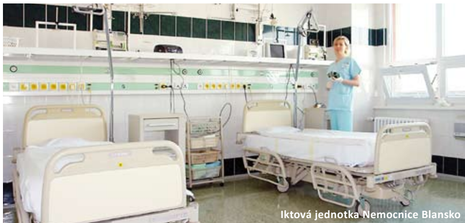
Iktová jednotka Nemocnice Blansko

Nemocnice Blansko získala prestižní ocenění. Ministerstvo zdravotnictví ČR ji totiž zařadilo do seznamu komplexních cerebrovaskulárních center a iktových center. Ocenilo tak cerebrovaskulární program v Nemocnici Blansko, který zajišťuje specializovanou péči pro pacienty s cévní mozkovou příhodou (CMP). Nemocnice Blansko se zařadila mezi úzký okruh vysoce specializovaných pracovišť.